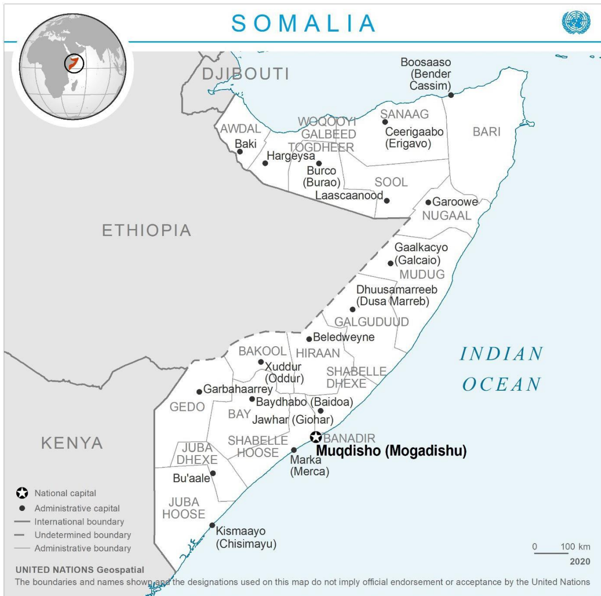
Тази карта е възпроизведена от секция „Геопространствена информация“ на ООН. © Организация на обединените нации